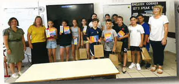
Les CM2 quittent l'école munis d'une calculatrice offerte par la mairie