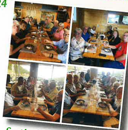
Sortie CCAS 9 septembre