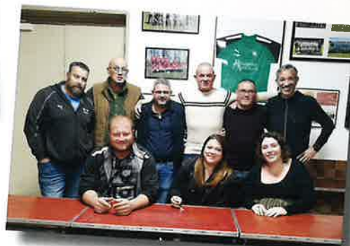
Assemblée générale du Cercle du printemps & Bureau 9 novembre