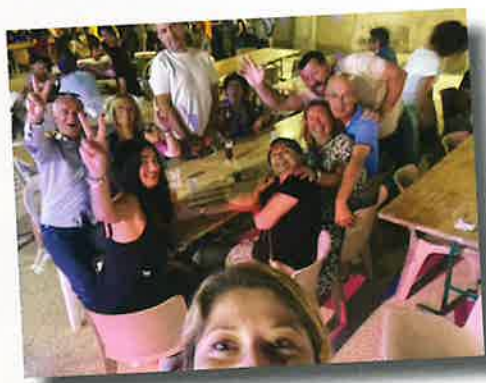
Fête de la musique au Bar des Colonnes le 21 juin