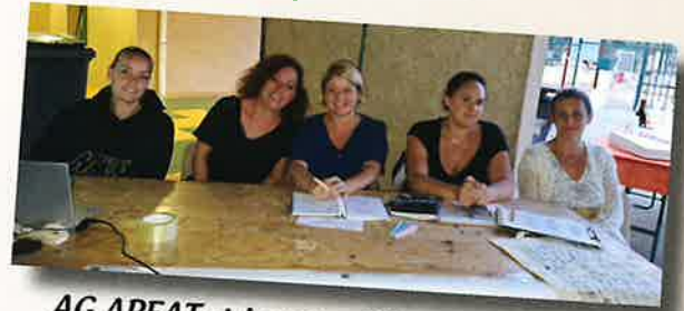
AG APEAT et bureau 20 septembre