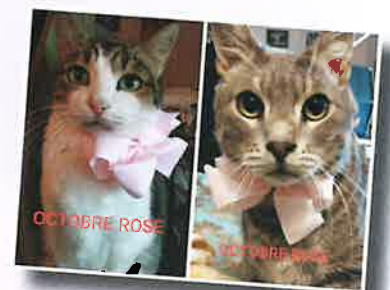
LES CHATS LIBRES DE THEZIERS