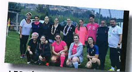
LES FÉMININES DE L'EST