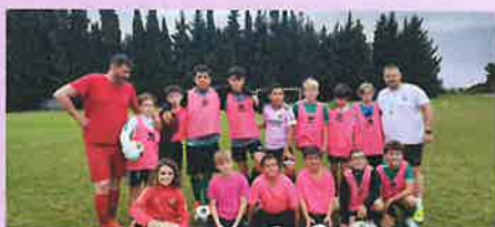
ETOILE SPORTIVE THEZIEROISE - EST