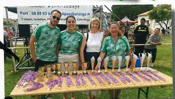
Tournoi annuel de l'Etoile Sportive Théziéroise le 8 juin, une nouvelle réussite