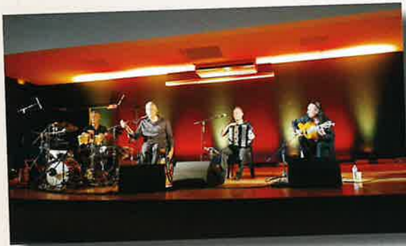
Show Nougaro 1 er juin

L'anniversaire du Shaw Nougaro fêté comme il se doit.