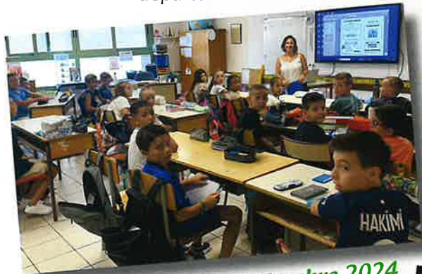
Rentrée scolaire septembre 2024