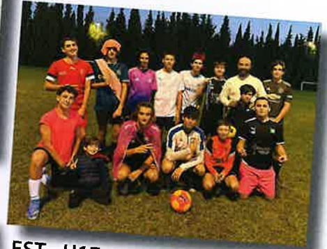
EST - U17