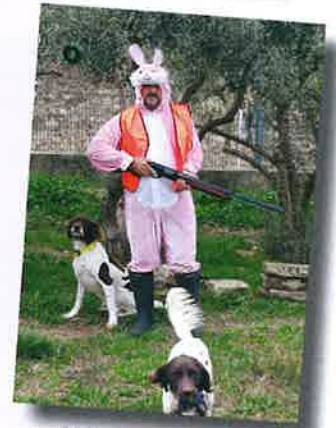
LE PRESIDENT DE LA DIANE THEZIEROISE