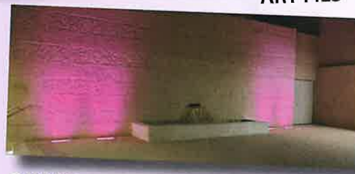
QUAND LA PLACE TEDUSIA SE MET AUX COULEURS D'OCTOBRE ROSE