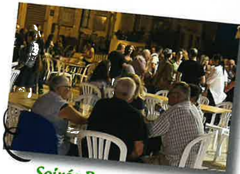
Soirée Bar des colonnes 7 septembre