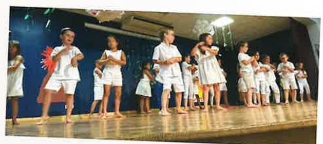
Fête des écoles 22 juin