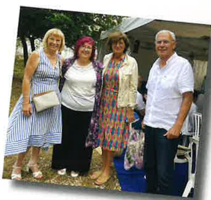
Défilé anniversaire de Styl Création le 29 juin en présence de M me le Maire et de nos conseillers départementaux