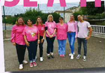
LE PERSONNEL DE L'ECOLE