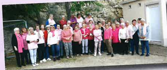
LA BELLE EPOQUE