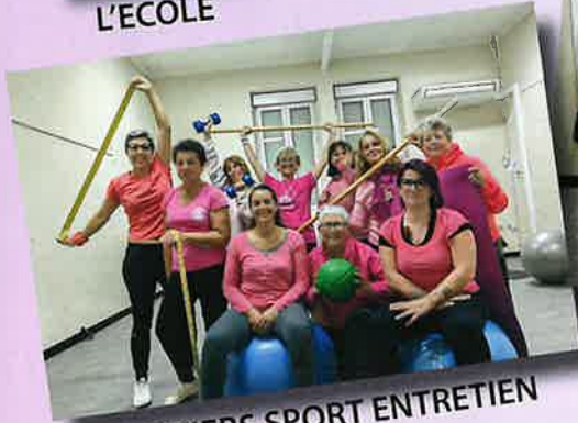
THEZIERS SPORT ENTRETIEN