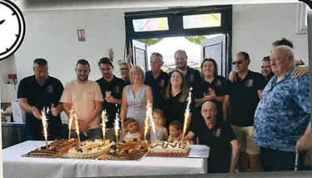
Un anniversaire particulier : les 100 ans du Cercle du Printemps le 1 er juin