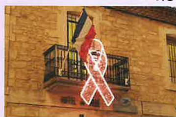
LA MAIRIE AUX COULEURS D'OCTOBRE ROSE