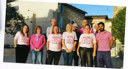
LE SECRETARIAT & LES SERVICES TECHNIQUES ACCOMPAGNÉS DES ADJOINTS