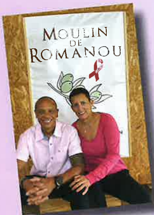
MOULIN DE ROMANOU